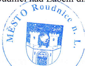
Vladimír Urban starosta

V Roudnici nad Labem dne 22. 1. 2013 Ve Straškově-Vodochodech dne 22. 1. 2013